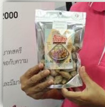
ภาพที่ไม่สื่อถึงความหมาย เนื่องจากขาดฉากหลัง

ต้องคำนึงถึงภาพที่ออกมาว่า ต้องการสื่อถึงอะไร ต้องถ่ายภาพให้มีฉากหลังที่ชัดเจน ครอบคลุมเนื้อหาเหตุการณ์