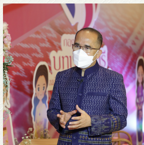
🔍 ระยะใกล้ ✕

คือระยะใกล้ ระยะกลาง ระยะไกลหรือ อย่างน้อยให้มีภาพในระยะใกล้กับระยะไกล ไว้ก่อน เพื่อที่จะสามารถเชื่อมโยงกับเนื้อหา ที่เสนอได้ เมื่อนำภาพไปประชาสัมพันธ์ ก็ควรจัดให้มีอย่างน้อย 2 ระยะ เพื่อสื่อถึงเหตุการณ์นั้น ๆ