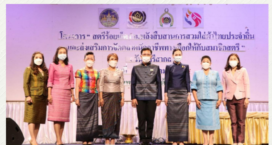
🔍 ระยะกลาง ✕