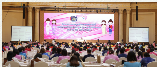
🔍 ระยะไกล ✕