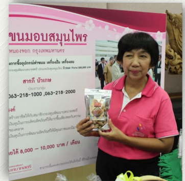
ภาพที่สื่อถึงความหมายได้ดี บ่งบอกเหตุการณ์นั้น ๆ ได้